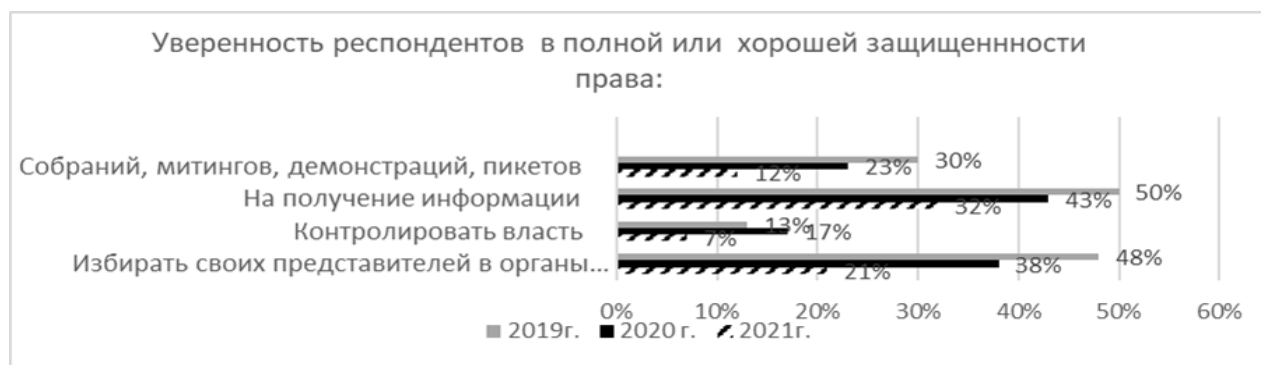
Рис. 3. Оценка респондентами защищенности важных для empowerment прав человека в динамике

С тем, что в российском обществе полностью или значительно господствуют права человека согласны менее четверти респондентов (23 % в 2021 г.). В целом, обследование зафиксировало снижение оценок респондентами защищенности важнейших для empowerment прав граждан.