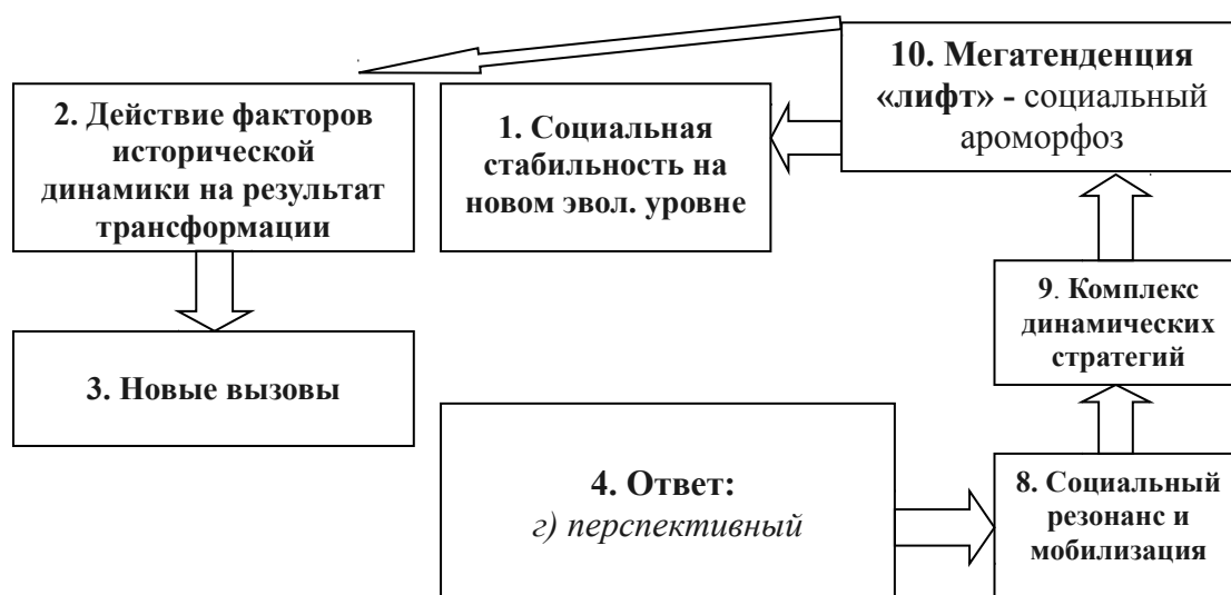
Рис. 2. Контур крупных эволюционных скачков (прогрессивных революций, социальных ароморфозов).

Как завоевания, характерные для империй, так и геоэкономическая экспансия, характерная для современного капитализма, успешно продолжают в течение двух и более поколений, только если сопровождаются социоинженерной (создание полицейских, налоговых, судебных, финансовых структур и служб) и культурной (распространение религии, идеологии, образования, стандартов материального и духовного потребления) динамических стратегий.