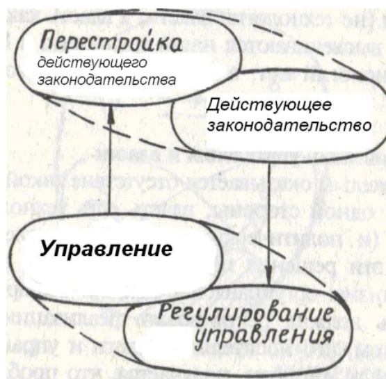
Рис. 3. Интерпретация отношения управления и законодательства по схеме «процесс — механизм» (пояснения в тексте)

в этой коллизии, можно с помощью схемы «процесс-механизм» [Щедровицкий 1975с]. Будем считать, что управление выступает в роли механизма, обеспечивающего процесс изменения законодательства. Но изменение законов в силу приписанной им власти, со своей стороны, меняет работу управленца. Если мы хотим сохранить стабильность системы, здесь возникает жёсткое требование к законодателям: новые законы могут менять условия управленческой деятельности, но не должны ей мешать. Тогда, как пишет Щедровицкий [там же: 171], «мы можем осуществить симметричное оборачивание схемы и рассмотреть сам исходный процесс (в нашем случае изменения законодательства — М.Р., С.К.) как механизм, производящий процесс изменений в той структуре, которая изначально выступала у нас в роли механизма» (т. е. в системе управления — М.Р., С.К.). В итоге получается «слойка из двух противоположно ориентированных структур, как бы наложенных друг на друга» (рис. 3).