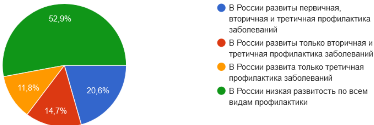
Рис. 1. Распределение ответов на вопрос № 1 «Как Вы оцениваете состояние профилактической медицины в Российской Федерации?»

По мнению большинства опрошенных, в России низкая развитость всех видов профилактики – 52,9 %. Часть опрошенных 20,6 % считает, что в России развиты все три вида профилактики: первичная, вторичная и третичная 6 . Другая часть опрошенных считает, что в России развиты только вторичная и третичная профилактики – 14,7 %, и 11,8 % респондентов ответили, что в России распространена только третичная профилактика (см. рис. 1).