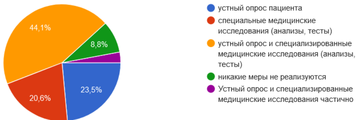
Рис. 2. Распределение ответов на вопрос № 2 «Какие меры выявления предрасположенности к заболеваниям реализуются в современной системе здравоохранения РФ, которые доступны по ОМС?»

ется только устный опрос пациента – 23,5 %, а вторая утверждает о применении только специализированных тестов и анализов – 20,6 %. Малая доля опрошенных считает, что никакие меры по выявлению предрасположенности к заболеваниям не предпринимаются – 8,8 % (см. рис 2).