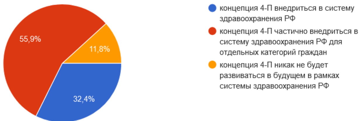
Рис. 5. Распределение ответов на вопрос № 10 «Какое будущее ждёт концепцию 4-П в системе здравоохранения РФ?»