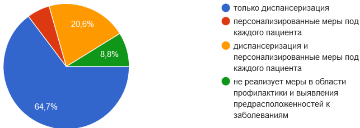
Рис. 3. Распределение ответов на вопрос №6 «Какие меры государство осуществляет в области профилактики и выявления предрасположенностей к заболеваниям?»

По мнению большинства респондентов, единственной мерой по профилактике заболеваний, реализуемой на данный момент в системе здравоохранения РФ является диспансеризация – 64,7 %. Другие отмечают о том, что действуют диспансеризация и персонализированные меры – 20,6 %. Малая доля опрошенных отмечает то, что для профилактики заболеваний предусмотрены исключительно персонализированные меры – 5,9 %. Также часть опрошенных считает, что нынешняя система здравоохранения РФ не предполагает никаких мер профилактики – 8,8 % (см. рис. 3).